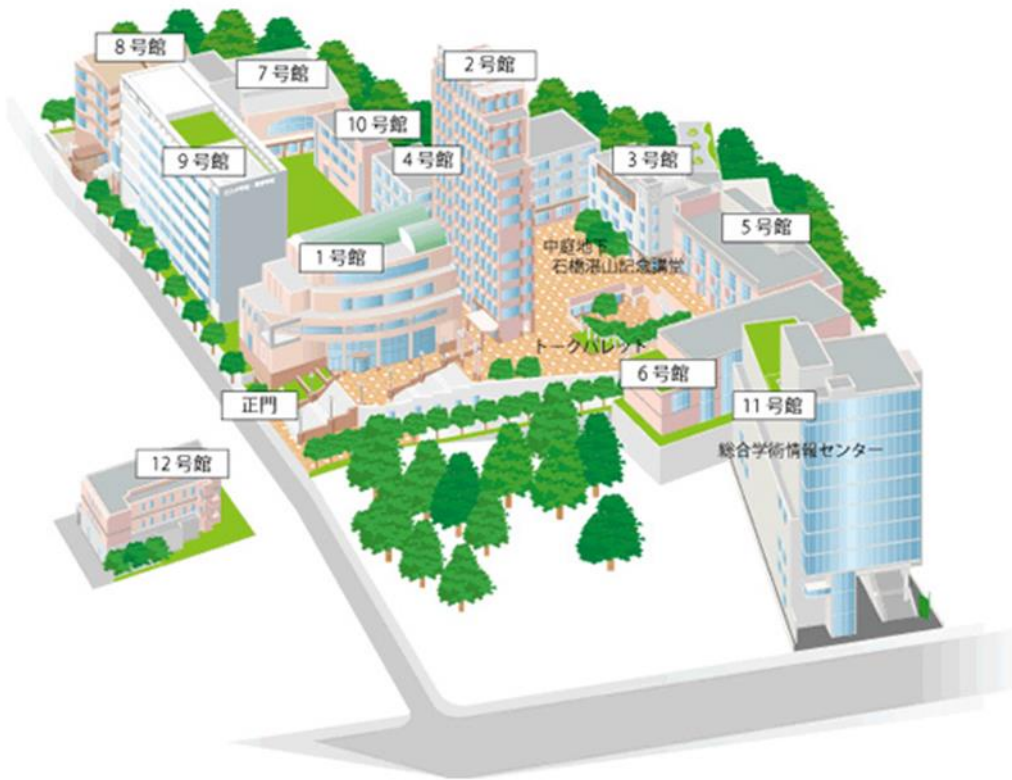
立正大学品川キャンパス